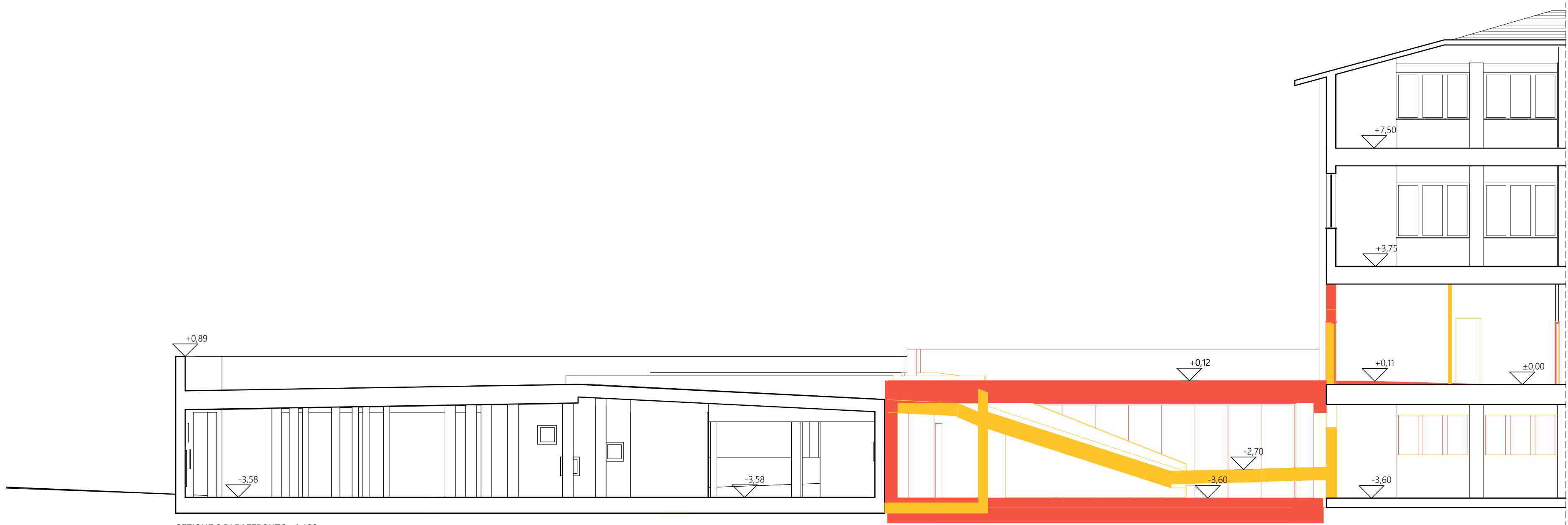
SEZIONE C DI RAFFRONTO - 1:100